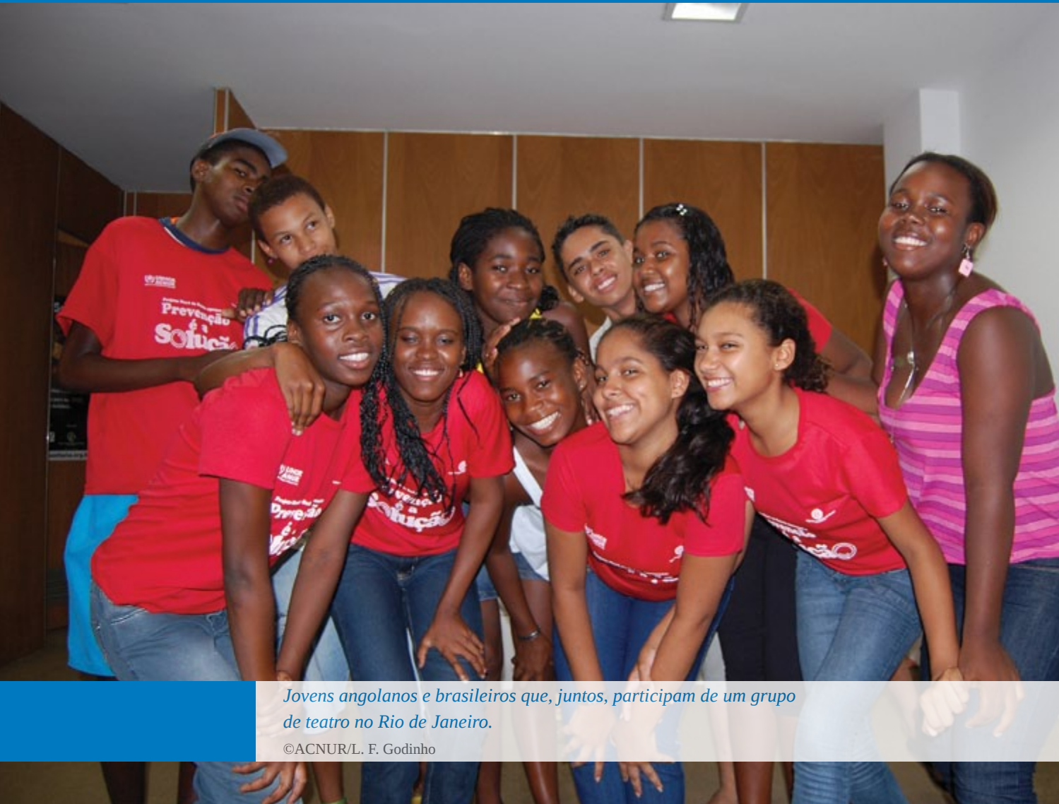
Jovens angolanos e brasileiros que, juntos, participam de um grupo de teatro no Rio de Janeiro.