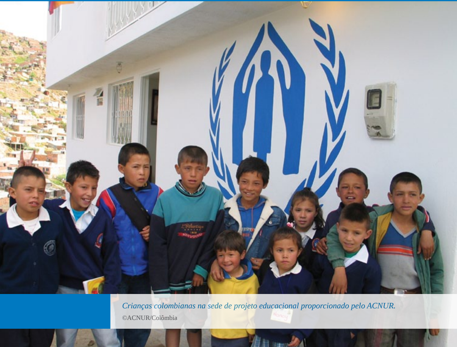
Crianças colombianas na sede de projeto educacional proporcionado pelo ACNUR.